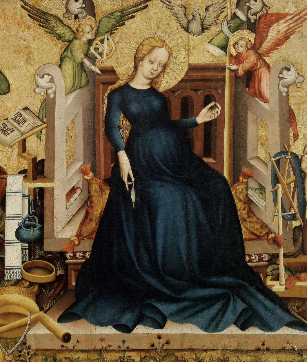
Maria Grávída, táblakép töredéke Németújvárról, 1409