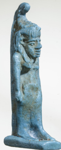
Szelketnek, a skorpiók és kígyók istennőjének amulettje Szépművészeti Múzeum, Egyiptomi Gyűjtemény, ltsz. 69.12-E

Az egyiptomi elképzelések szerint az úgynevezett Hórusz-sztélék mágikus védelmet biztosítottak a Nílus-völgyet benépesítő veszélyes állatok ellen. A sztélé két fő figurája az ártó erőktől védelmező Bész isten nagy méretű, oroslánfejszerű maszkja, valamint a krokodilokon taposó, meztelen Hórusz-gyermek, aki mindkét kezében veszélyes állatokat (kígyót, skorpiót, oroslánt és antilopot) tart. A táblára vésett feliratok mágikus szöveget tartalmaznak. Az egyiptomi elképzelések szerint a skorpiómarásból Thot isten segítségével felépült Hóruszéhoz hasonló gyógyulás mindazok számára lehetséges volt, akik megitták a mágikus táblára öntött, annak varázsserejét magába szívó vizet.