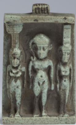
Triász amulett a gyermek Hórusz, Nephthüsz és Ízisz istennő alakjával Szépművészeti Múzeum, Egyiptomi Gyűjtemény, Iksz. 51.2284