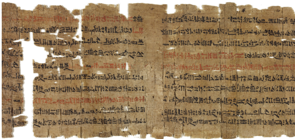
Papirusz gyógyító-mágikus szöveggel, részlet Szépművészeti Múzeum, Egyiptomi Gyűjtemény, ltsz. 51.1961.

Gyógyítással általában férfiak foglalkoztak, a nők bábaként vagy szoptatós dajkaként segítettek az asszonyokat.