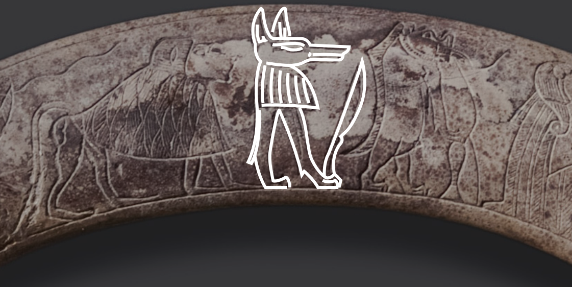
Varázsszék, részlet Szépművészeti Múzeum, Egyiptomi Gyűjtemény, ltsz. 2005.1-E

A tárgy megnézhető közelebbről itt: https://www.szepmuveszeti.hu/mutargyak/apotropaion/