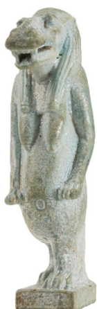
Thoerisz-szobrocška Szépművészeti Múzeum, Egyiptomi Gyűjtemény, ltsz. 51.2317

amelyek segítségével az istennő a meggyilkolt Oziriszt újra életre keltette. Egy másik történet szerint pedig Thot gyógyította meg a még gyermek Hórusz istent a skorpiómarásból.