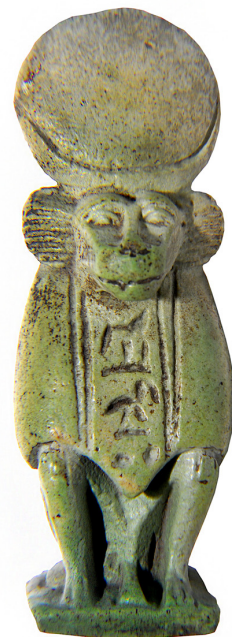
Thot pávián felirattal Szépművészeti Múzeum, Egyiptomi Gyűjtemény, Iksz. 51.2177

A gyógyító istenek közül kiemelkedik Thot, a bölcsesség, a tudomány és az orvoslás istene, akit Egyiptomban a korai időktől egészen a római korig országszerte tiszteltek. Az íbiszmadár vagy kutyafejű pávián alakjában ábrázolt istenséget a korai időktől a Holddal kapcsolták össze, és Ré napisten éjszakai megtestesülésének tartották. Thot az írás felfedezőjeként az írnokok patrónusa és az isteni igazságosság jelképe is volt. Az egyik mitikus történet szerint az isten tanította Ízisznek azokat a varázsigéket,