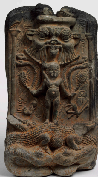
Hórusz-sztélé Szépművészeti Múzeum, Egyiptomi Gyűjtemény, ltsz. 96.1-E

Az úgynevezett Kígyómarás-papyrusz középen kettévágott darabjait ma a Brooklyn Museumban őrzik: