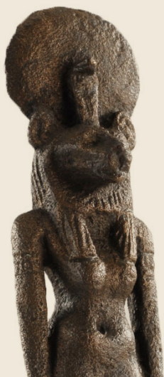
Szakhmet istennő szobrocskája Szépművészeti Múzeum, Egyiptomi Gyűjtemény, ltsz. 83.11-E