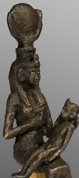
Gyermekeit szoptató Ízisz Szépművészeti Múzeum, Egyiptomi Gyűjtemény, Iksz. 63.1-E