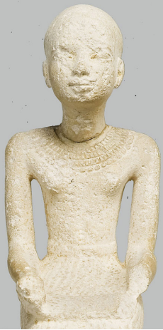
Imhotep szobrocája Szépművészeti Múzeum, Egyiptomi Gyűjtemény, ltsz. 54.10