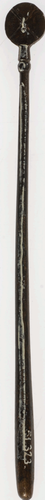
Ez a hosszú nyelű kis kanál valószínűleg fül kezelésére szolgálhatott.

Az egyiptomi orvosok gyógyszeres kezeléssel és mágikus mondások alkalmazásával egyszerre gyógyították betegeiket, akiket gyakran Hórusz istennel azonosítottak. A mítosz szerint Hórusz születése után veszélyben volt; nagybátyja, Széth haragja elől anyja, Ízisz istennő a Nílus deltájában egy mocsárvidéken rejtette el. Ízisz hatalmas varázs- és gyógyító erővel rendelkezett, és fiát többször kigyógyította különböző súlyos vagy halálos betegségekből, illetve később a Széthtel folytatott harc során szerzett sérüléseiből. A varázsigék segítségével a Hórusz istenné változott beteg részesülhetett annak csodálatos gyógyulásából is.