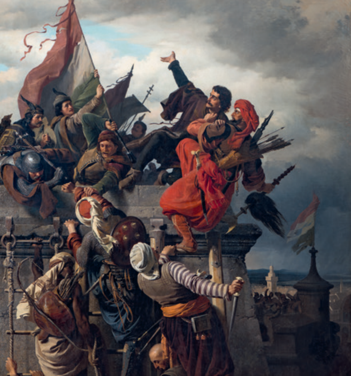
Wagner Sándor: Dugovics Titusz önfeláldozása, 1859

W agner Sándor képe az 1456-os nándorfehérvári csata emblematikus jelenetét ábrázolja. A török túlerővel küzdő magyar csapatokat Hunyadi János segítségükre siető zsoldoserege és egy keresztesekből álló sereg segítette győzelemre.